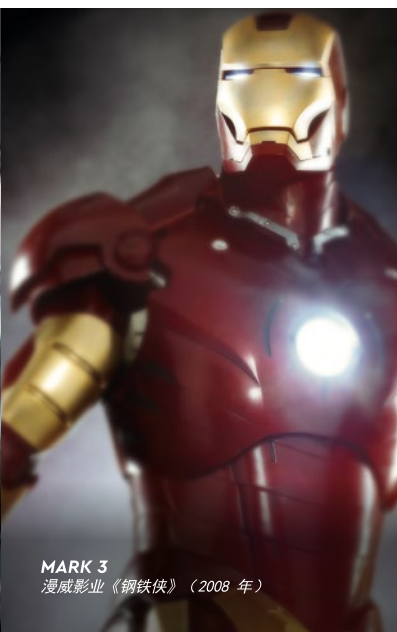
MARK 3 漫威影业《钢铁侠》（2008年）