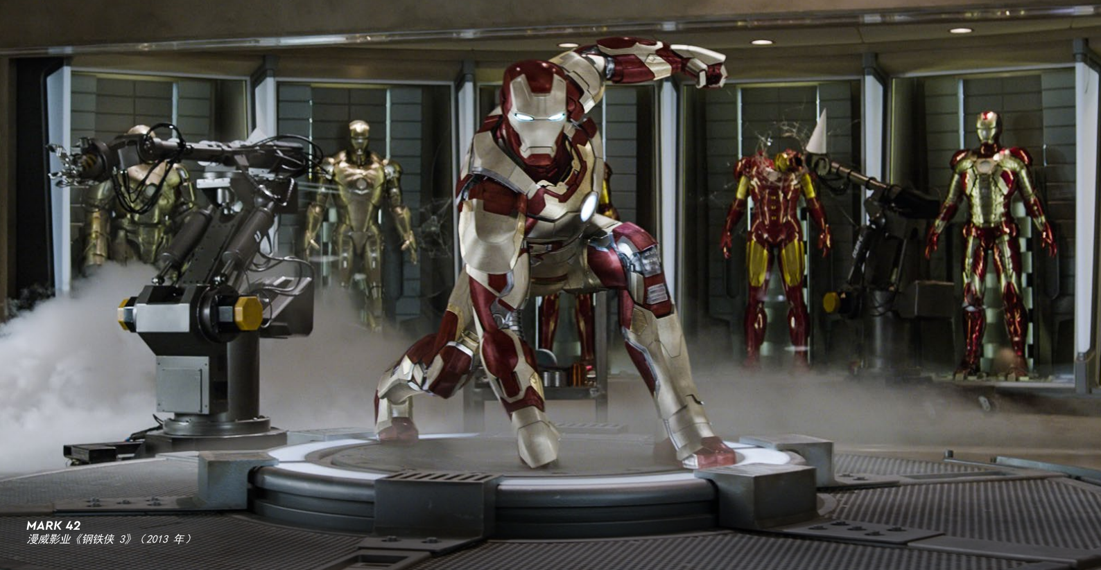
MARK 42 漫威影业《钢铁侠 3》(2013 年)