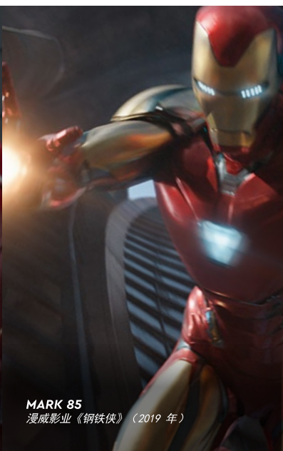
MARK 85 漫威影业《钢铁侠》（2019年）