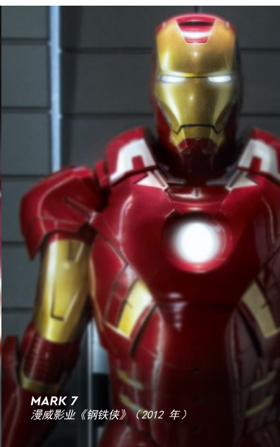
MARK 7 漫威影业《钢铁侠》（2012年）