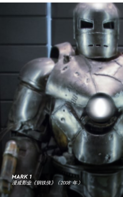
MARK 1 漫威影业《钢铁侠》（2008年）