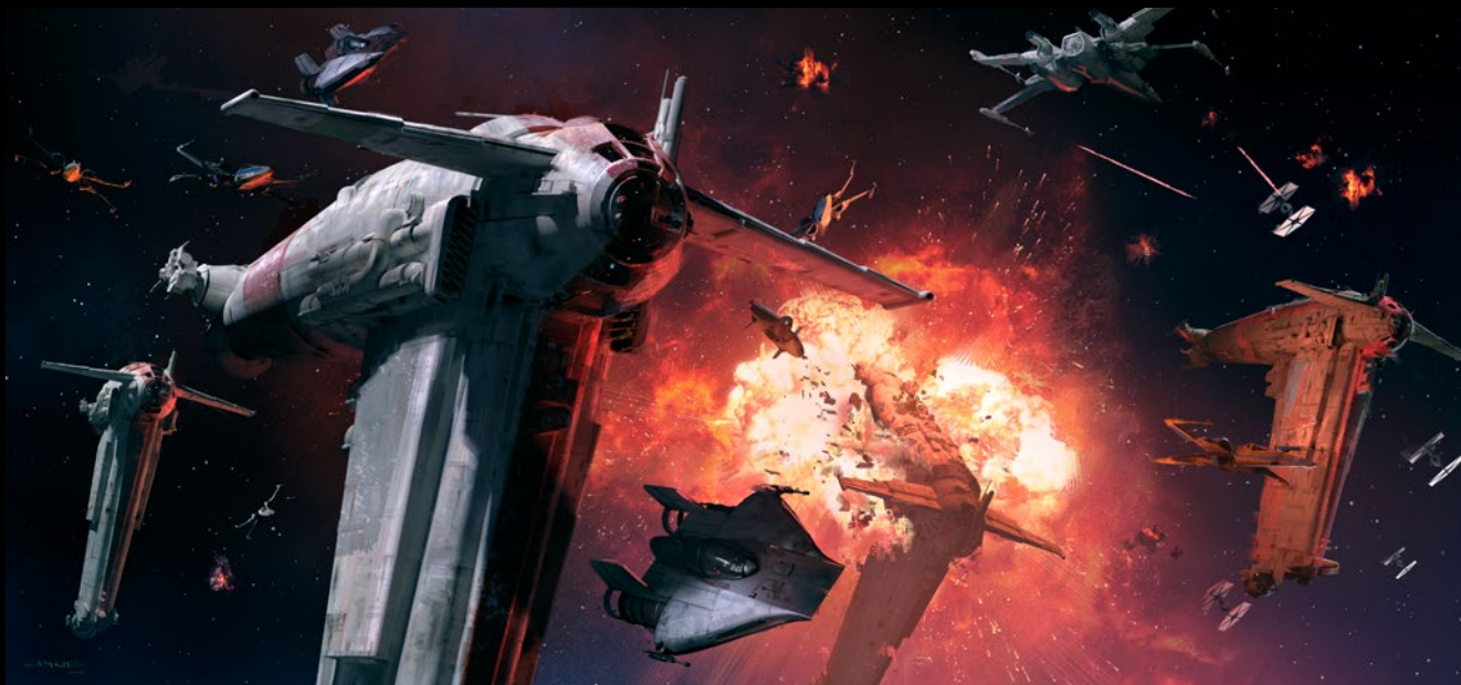
James Clyne © & ™ Lucasfilm Ltd.

D: L'A-wing è uno starfighter altamente aerodinamico, dotato solo dei suoi elementi da combattimento e di volo rapido. Qual è stata la