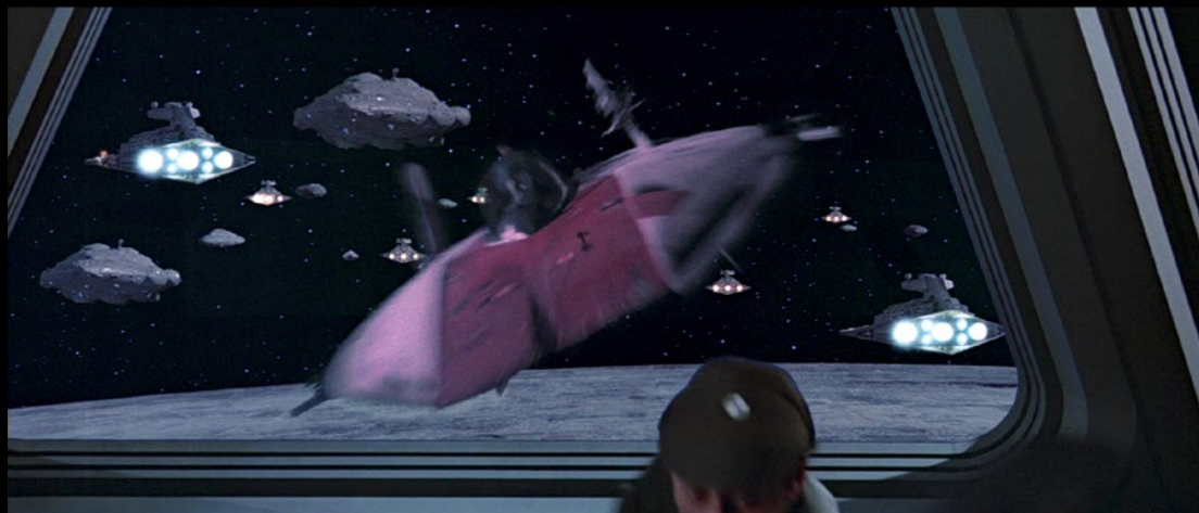
Star Wars: Return of the Jedi (1983) © & ™ Lucasfilm Ltd.

R: L'apprezzamento dei set LEGO Star Wars assume molte forme - dal gioco con il modello ai collezionisti che lo conservano nella scatola sigillata. L'uso ideale dei set della Ultimate Collector Series è ovviamente la costruzione e l'esposizione, su uno scaffale o una scrivania. Puoi sempre acquistare un'altra scatola in seguito per la tua collezione, giusto?