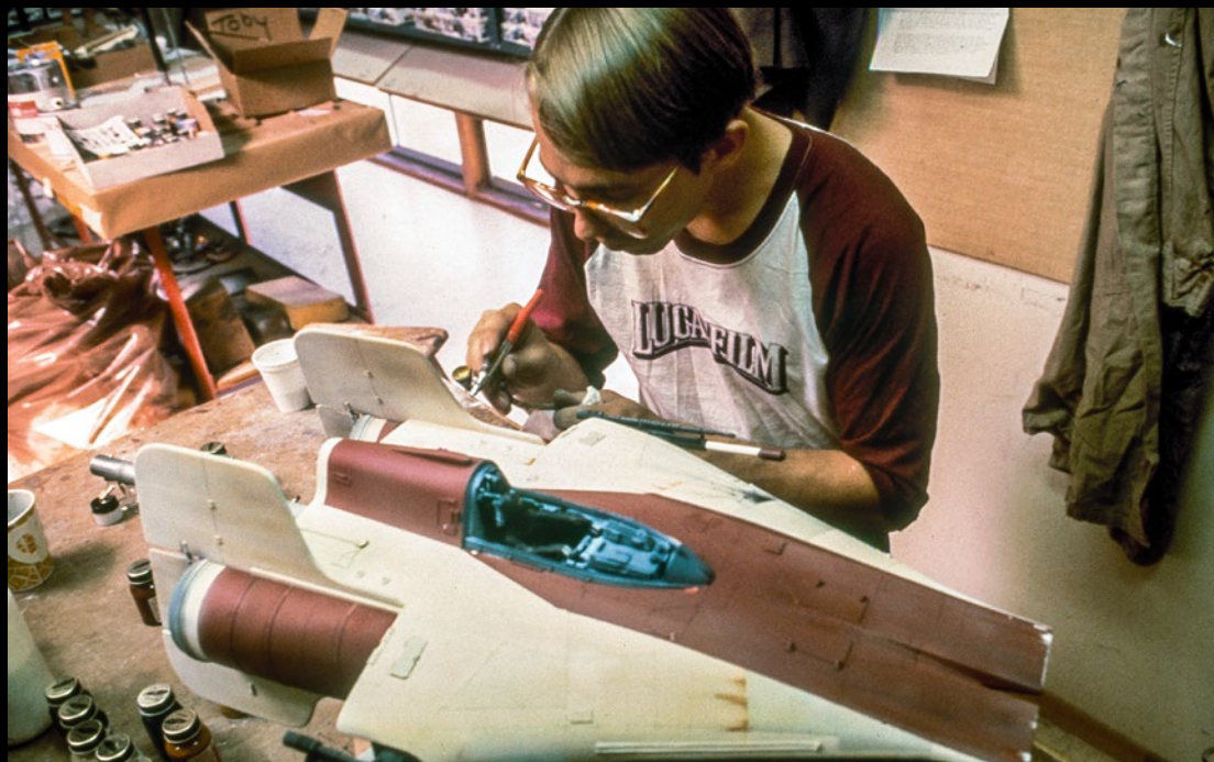
Wesley Seeds Ilm dipinge un modello di A-wing per Star Wars: Return of the Jedi (1983) © & ™ Lucasfilm Ltd.