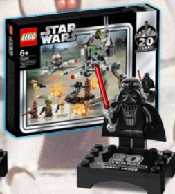
1999 DARTH VADER™ MINIFIGURE DA COLLEZIONE 75261