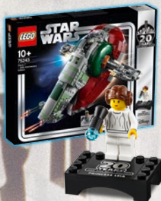
2000 PRINCIPESSA LEIA™ MINIFIGURE DA COLLEZIONE 75243

LEGO and the LEGO logo are trademarks of the LEGO Group. ©2019 The LEGO Group. © & ™ Lucasfilm Ltd.