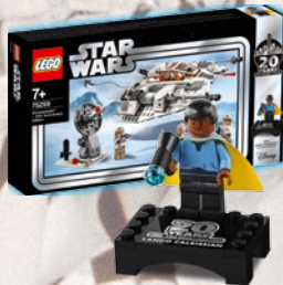
2003 LANDO CALRISSIAN™ MINIFIGURE DA COLLEZIONE 75259