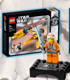
1999 LUKE SKYWALKER™ MINIFIGURE DA COLLEZIONE 75258