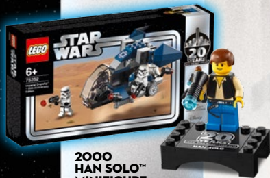
2000 HAN SOLO™ MINIFIGURE DA COLLEZIONE 75262