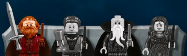
Godric Gryffondor Helga Poufsouffle Salazar Serpentard Rowena Serdaigle