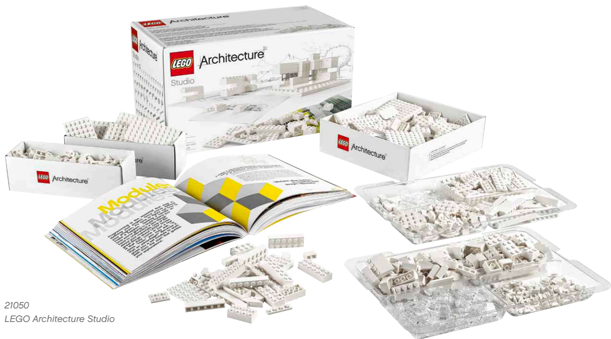
21050 LEGO Architecture Studio

La introducción del set LEGO Architecture Studio recupera las ambiciones de la antigua línea «Scale Model» de LEGO y amplía el potencial de la serie LEGO Architecture. Hoy puedes disfrutar mientras construyes y aprendes sobre edificios célebres, o crear tus propios modelos arquitectónicos a partir de tu imaginación. Un instructivo libro de 270 páginas con materiales creados por arquitectos internacionales de gran reputación te guiará a través de los principios de la arquitectura y te animará a dar tus primeros pasos en el mundo de la construcción creativa.