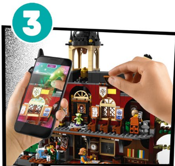
隠れているものを見つけ出そう