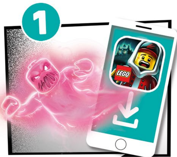
アプリをダウンロード

リリース後も、新しいゴースト、新しいゲームチャレンジが追加され、ゲームプレイがランダム化し続けるため、お子様は遊ぶたびに新しいプレイが楽しめます。