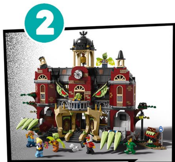
セットを組み立てよう