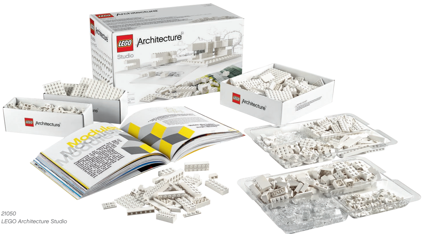
21050 LEGO Architecture Studio

L'introduction de notre ensemble LEGO Architecture Studio fait écho aux ambitions de la précédente gamme «Maquettes à l'échelle» LEGO et accroît le potentiel de la gamme LEGO Architecture. Vous pouvez maintenant découvrir et construire des monuments célèbres ou créer de passionnants modèles architecturaux nés de votre imagination. Un livret d'inspiration de 270 pages, présentant plusieurs architectes célèbres du monde entier, vous guide parmi les principes de l'architecture et vous encourage dans votre propre construction créatrice.