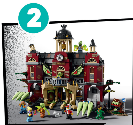
COSTRUISCI IL SET