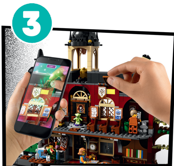
ESPLORA IL MISTERO