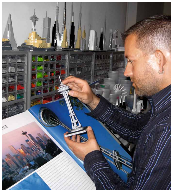
– Adam Reed Tucker

Enquanto artista arquitectónico, o meu desejo é apreender a essência de um particular edifício histórico na sua forma escultural pura, especialmente a esta pequena escala. Primeiro e antes de tudo, não vejo os meus modelos como réplicas literais, mas sim como interpretações artísticas, explorando a essência destes edifícios históricos através do uso de peças LEGO®. A peça LEGO não é inicialmente pensada para ser um material tipicamente usado na criação de arte ou usado para servir de meio a um artista. Descobri rapidamente que a peça LEGO se prestava tão naturalmente às minhas aplicações como a tinta para o pintor ou o metal para o ferreiro. Como eu exploro a forma de apreender estes edifícios com as formas básicas das peças, acho as possibilidades e desafios que elas proporcionam quase mágicos.