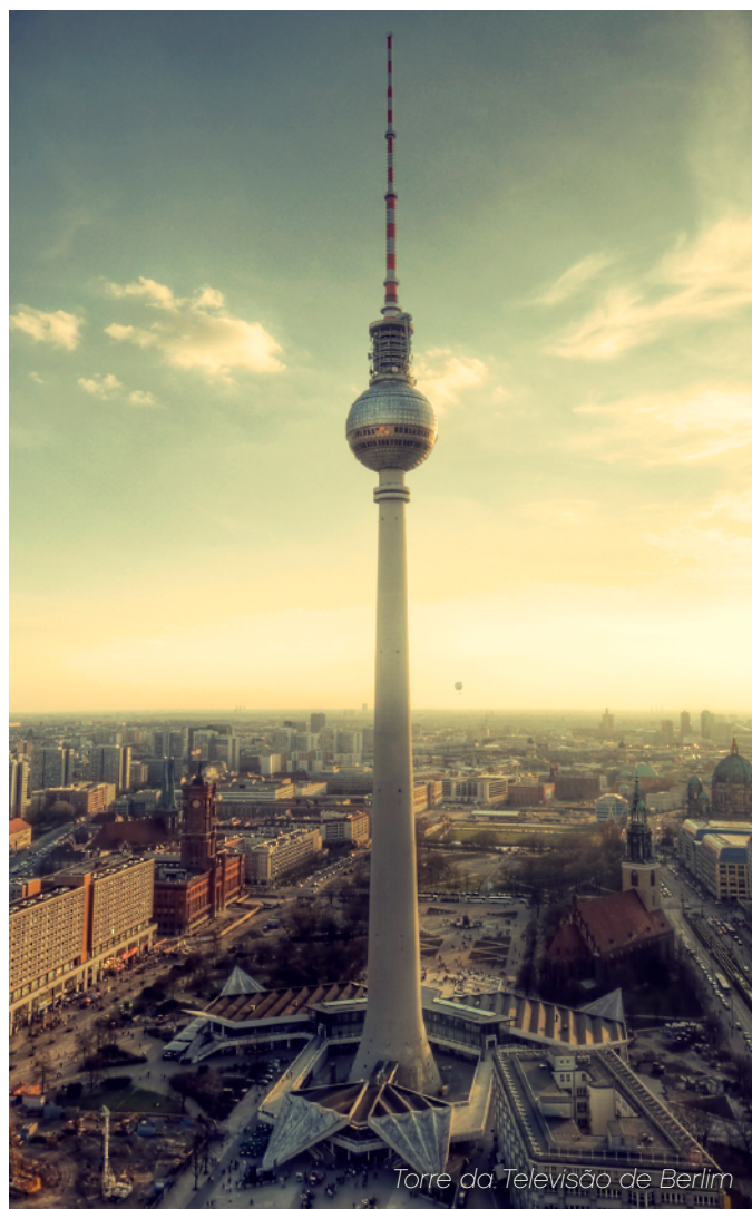
Torre da Televisão de Berlim

A Torre da Televisão de Berlim continua a ser a estrutura mais alta da Alemanha e um destino popular para quase 1,2 milhões de visitantes todos os anos.