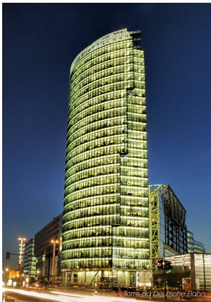
Torre da Deutsche Bahn

Inaugurado em junho de 2000, o bloco de escritórios, é agora também sede da Deutsche Bahn AG, a companhia de caminhos de ferro nacional da Alemanha, e é designada de Torre da Deutsche Bahn. O edifício é a mais alta estrutura na Potsdamer Platz.