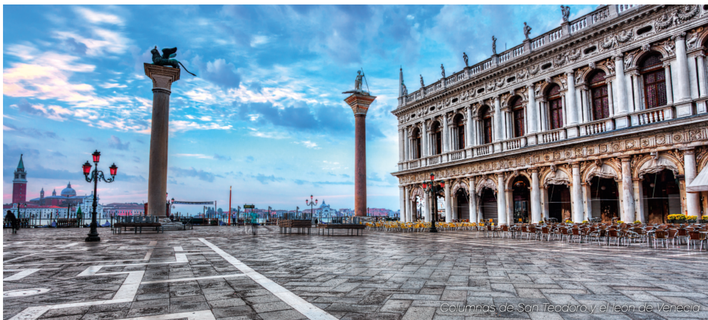
Columnas de San Teodoro y el león de Venecia