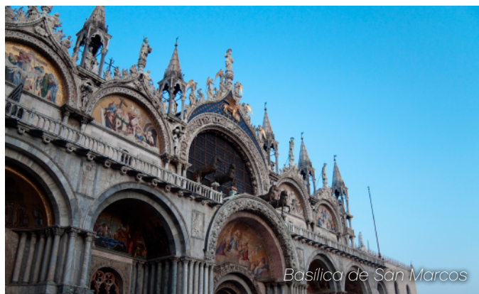
Basílica de San Marcos

Símbolo de la riqueza y el poder de la República de Venecia, la basílica de San Marcos sigue siendo uno de los monumentos más importantes de la ciudad.